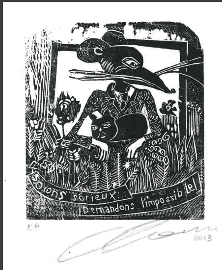
Soyons sérieux... Demandons l'impossible! Gravure sur bois de Claire Zahnd 2013

Contact 026 322 89 91 info@pilonaos.ch www.pilonaos.ch