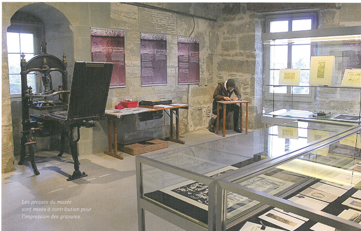
Les presses du musée sont mises à contribution pour l'impression des gravures.